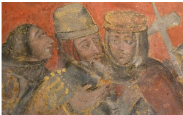
Fig. 16.2 : Détail du Ponce Pilate, cl. Y. Katsutani, 2015, indications de Y. Katsutani.