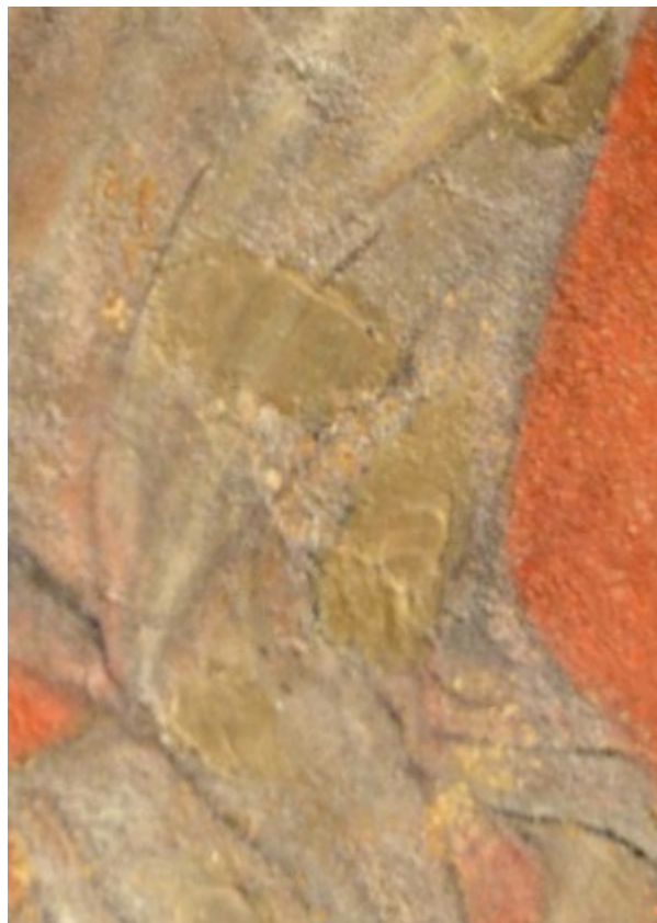
Fig. 24 : Détail d'un Ballet d'anges pleureurs, cl. Y. Katsutani, 2015.

différencier la partie restaurée de la partie originale. Elle est réversible et peut être corrigée ultérieurement. Il s'agit sûrement d'une restauration effectuée par Marcel Nicaud en 1959 selon les principes modernes. Comme les autres restaurations, ce type de retouches picturales se retrouve un peu partout sur les scènes les mieux conservées.