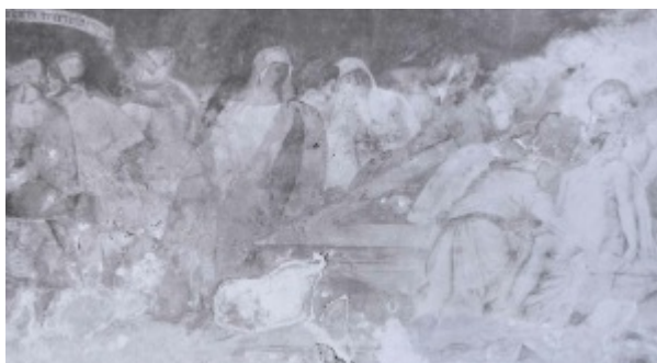
Fig. 11.1 : Photo de la Mise au tombeau par Ph. Hurault en 1952, Cité de l'architecture et du patrimoine – Collection du Musée des monuments français.