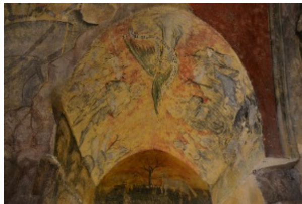
Fig. 4 : Noli me tangere, 2015.