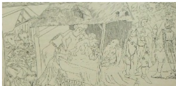
Fig. 9 : Dessin de la Nativité et l'Adoration des mages par C. Beauverie avant 1900 (Déchelette, 1900, p. 44), indication Y. Katsutani.