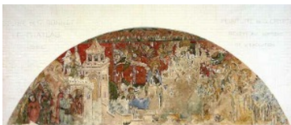
Fig. 7 : Photo du Couronnement de la Vierge avant 1900 (Déchelette, 1900, planche 13).