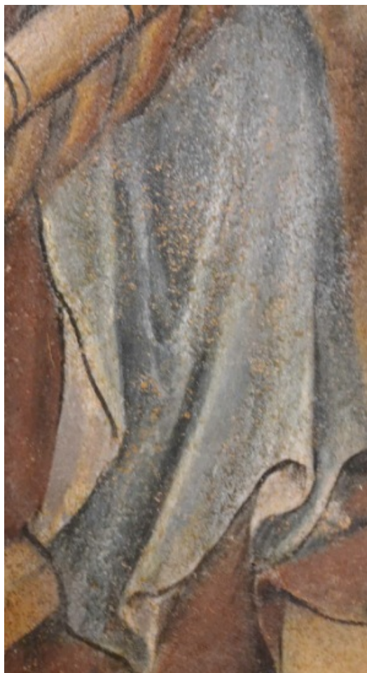
Fig. 22 : Les plis du vêtement de Joseph sur la scène de la Nativité, cl. Y. Katsutani, 2015.