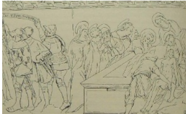
Fig. 5.2 : Mise au tombeau, cl. Y. Katsutani, 2015.