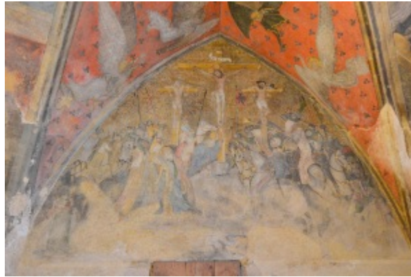
Fig. 25 : La Crucifixion, cl. Y. Katsutani, 2015.