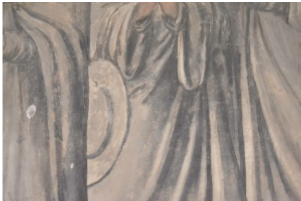
Fig. 18 : Détail de l'Annonciation, cl. Y. Katsutani, 2015.