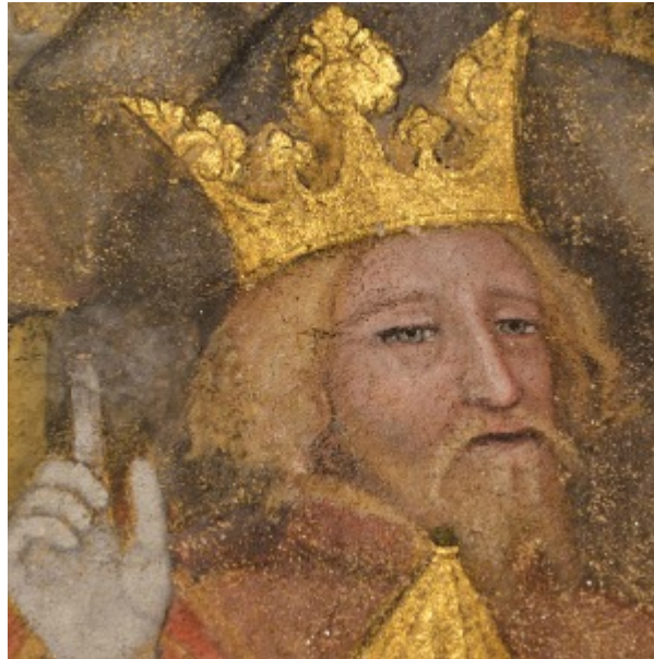
Fig. 20 : Visage de Melchior sur la scène de l'Adoration des Mages, cl. Y. Katsutani, 2015.

En quête de l'original. Une approche historiographique des peintures murales de la chapelle basse de la collégiale de Saint-Bonnet-le-Château (Loire, France)