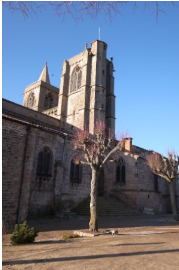
Fig. 1 : Collégiale de Saint-Bonnet-le-Château, cl. Y. Katsutani, 2015.

En quête de l'original. Une approche historiographique des peintures murales de la chapelle basse de la collégiale de Saint-Bonnet-le-Château (Loire, France)