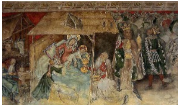
Fig. 15 : Photo de la Nativité et l'Adoration des Mages par M. Nicaud en 1959.