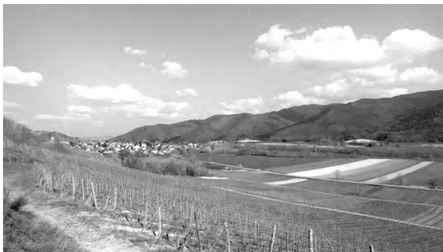
Figure 3 : Vue depuis le vignoble de Wihr-au-Val.