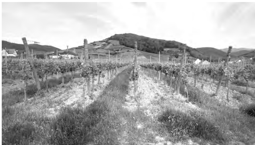
Figure 2 : Les bandes de sol nu sont bien visibles dans le paysage.