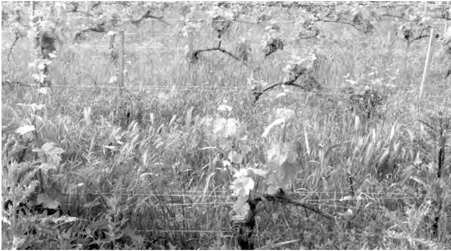
Figure 4 : Certains types d'enherbement peuvent donner à la vigne un aspect sauvage renvoyant à la perception d'un manque d'entretien.

été construits par l'action humaine et son histoire, conférant une spécificité à chaque vignoble. Ces vignobles moins structurés s'éloigneraient donc de l'unité du vignoble et de ses paysages typiques. Néanmoins, ils répondent aussi à un enjeu de diversification paysagère. Les vignobles alsaciens et badois présentent en effet des paysages variés qu'il s'agit de préserver 48 , mais également de promouvoir alors que les représentations du vignoble ont tendance à s'uniformiser 49 . Les arbres dans les parcelles ou en bordure et les terrasses peuvent largement contribuer à cette diversification paysagère, de même que d'autres modes de conduite (enherbement, palissage, etc.).