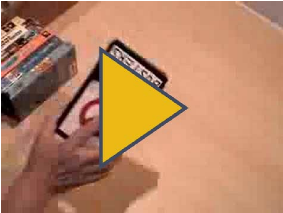
Bande annonce « suédée » de Soyez sympas, rembobinez ! ( https://www.youtube.com/watch?v=-B0dJQ35rDs ).