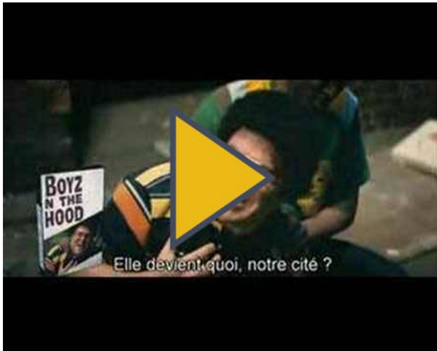
Bande annonce de Soyez sympas, Rembobinez ! ( https://www.youtube.com/watch?v=YEuxX1mVIHY ).