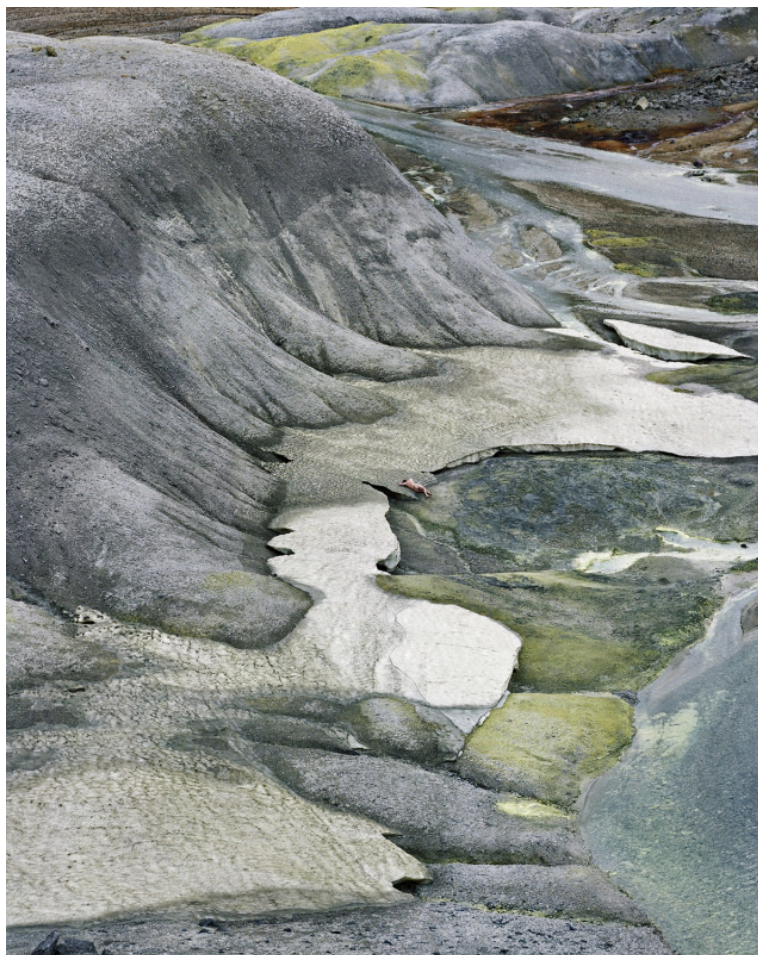
Photographie, Kurodake, Japan, 120 × 150 cm.