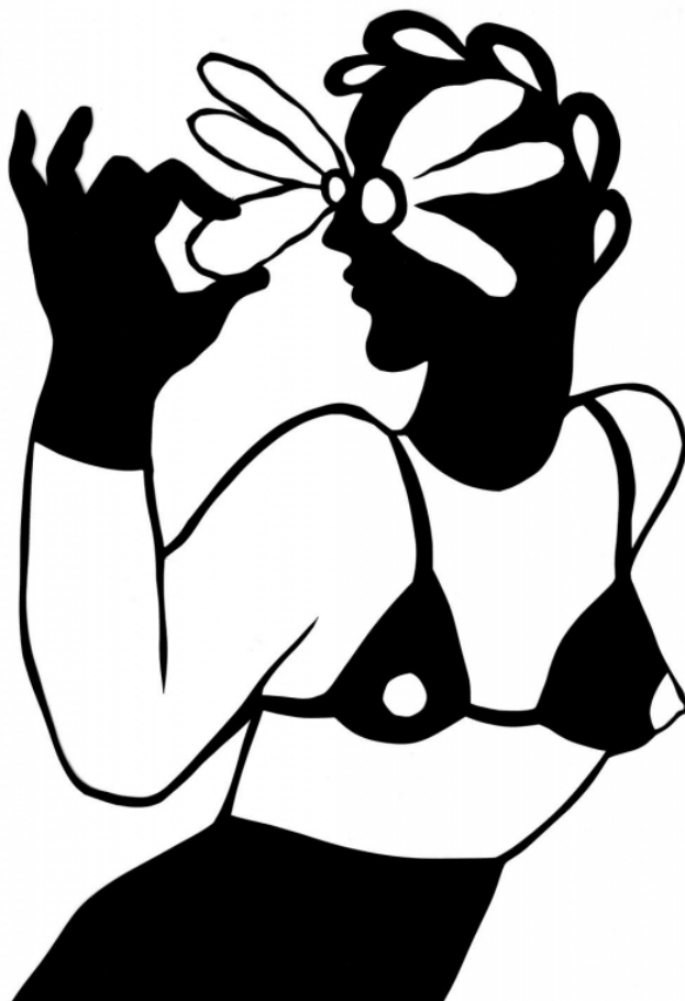
Fig.3b. Sarah Ménard, série des Salopes Décontractées , 2022