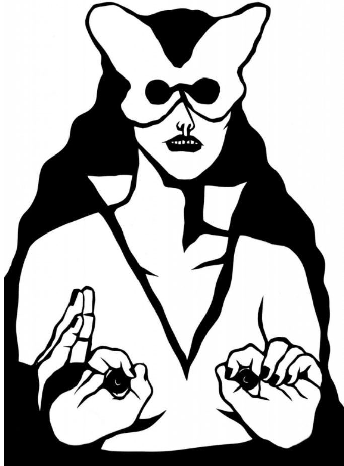
Fig.3a. Sarah Ménard, série des Salopes Décontractées , 2022