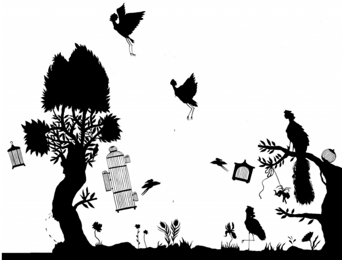
Fig.4. Sarah Ménard, Femmes-oiseaux , 2023

Installation murale, papier découpé, 700 × 600 cm.