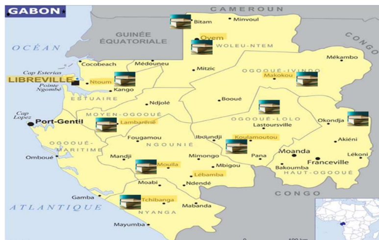
Figure 5: Cartographie des CLAC au Gabon réalisée pour cette recherche

Les centres de lecture et d'animation culturelle (CLAC) représentent des lieux indiqués pour mener les activités des clubs de lecture avec les jeunes lecteurs, car ils sont situés dans des zones accessibles et protégées et peuvent accueillir un large public. Le tableau ci-dessus fait apparaître les dix CLAC présents sur le territoire gabonais depuis 1993. Ils répondent à la vision culturelle du pays de renforcement de la politique nationale de lecture publique.