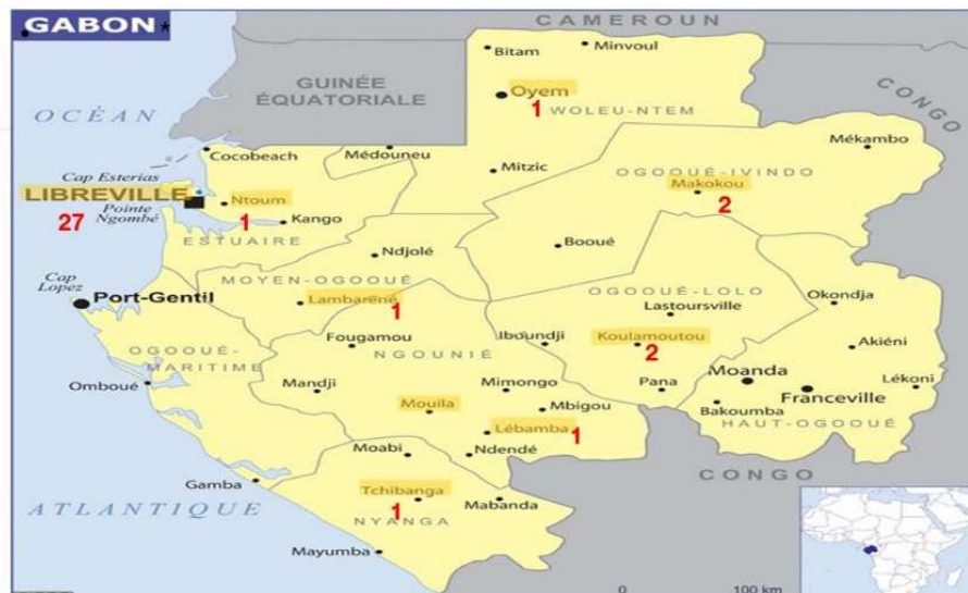
Figure 3 : Répartition de l'échantillon des professionnels réalisée durant cette recherche

Dans la figure 1, nous avons la répartition des CLAC au Gabon que nous avons identifié au nombre de 10 à savoir dans les villes de : Bitam, Oyem, Makokou, Okondja, Lastourville, Koulamoutou, Mouila, Tchibanga, Lambaréné et Ntoum. Sur les 36 répondants, très peu proviennent de villes ayant des CLAC (n=8) alors que Lébamba et Libreville, déclarées sans CLAC, concentrent la majorité des réponses (n=28).