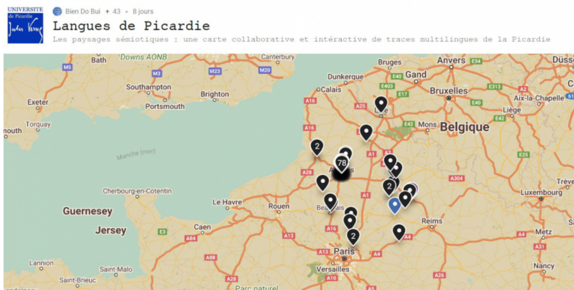
Figure 2. La carte interactive des paysages linguistiques