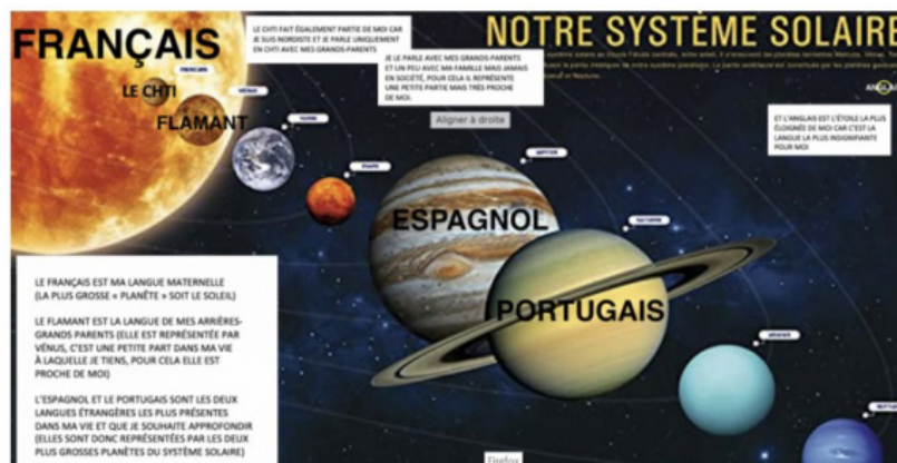
Figure 4. Visualisation et extrait de biographie langagière étudiant.e MEEF_B17 (2021)

« Le français est ma langue maternelle (la plus grosse "planète" soit le soleil).