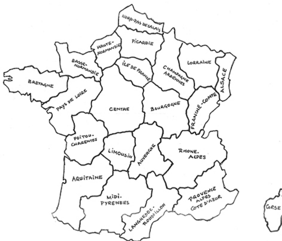
Carte 2. Les régions administratives de la France métropolitaine

présence dans la région où ils habitent d'un Conseil régional et de conseillers élus. Dans le grand public, on en entend parler au moins tous les six ans, au moment de l'élection des membres de ces Conseils 3 . Pour autant que je puisse en juger, ces découpages administratifs ne remplissent guère de fonction identitaire. Ils sont généralement bien plus larges que la province ou la région locale avec laquelle on peut s'identifier. Par exemple, la grande région Midi-Pyrénées réunit des espaces hétérogènes, tant du point de vue de la géographie physique que de celui de la géographie humaine, comme, par exemple, les Hautes-Pyrénées et le Lot, au sud du Massif Central.